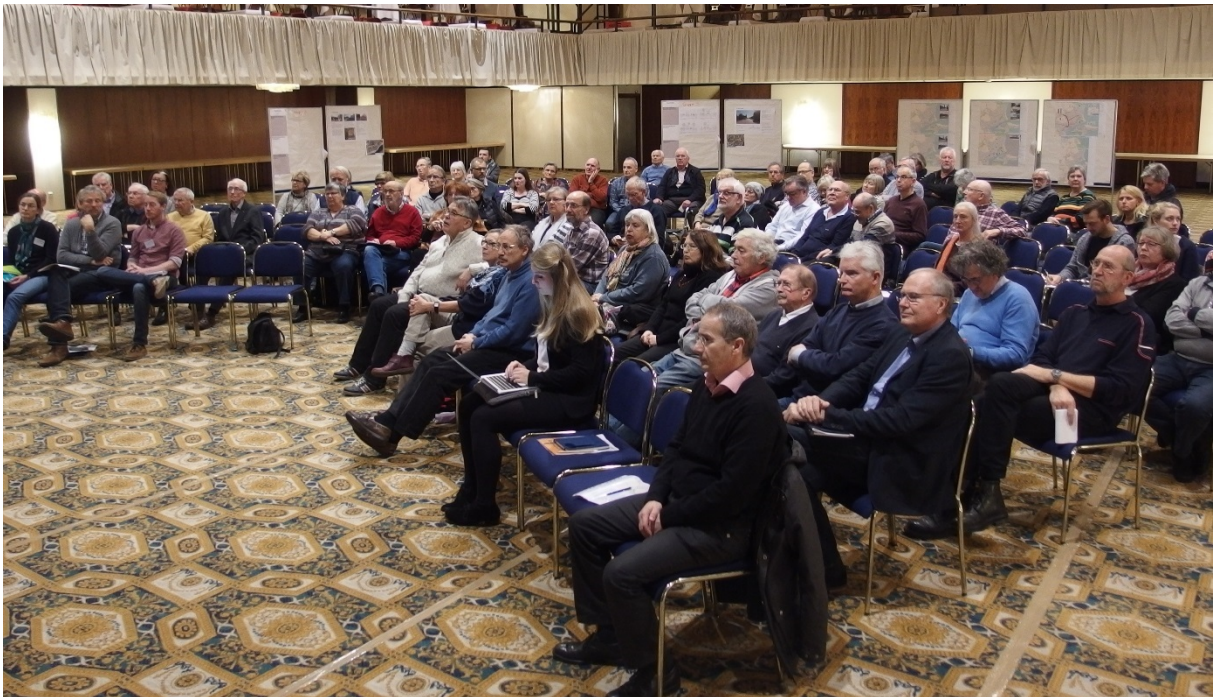
Kreis der Teilnehmerinnen und Teilnehmer

Herr Schröder ergänzt, dass derart große Anliegen an die Politik zu richten seien, die sich damit auseinandersetzen müsste. Am Skandinavienkai sei aber aufgrund immer höherer Sicherheitsanforderungen eine Mischung der Verkehrsarten schwierig.